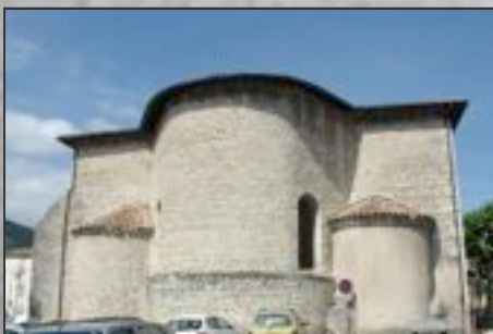
Abside et absidioles