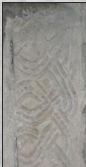
Fragments d'entrelacs carolingiens