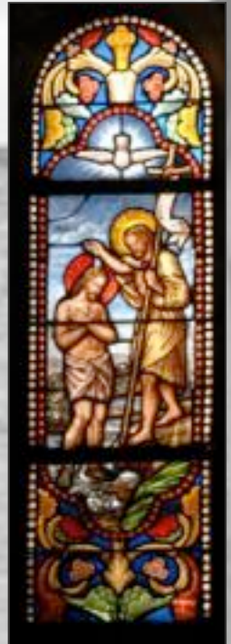
Vitrail Saint Jean Baptiste