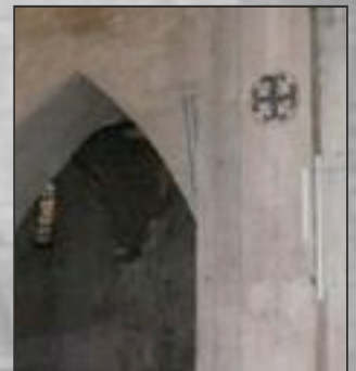
Croix de consécration