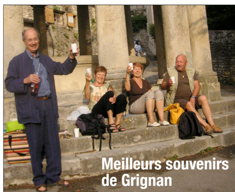
Meilleurs souvenirs de Grignan

6 NOVEMBRE 2010 SALLE POLYVALENTE 20 H 30