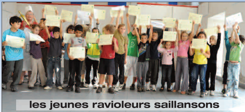
les jeunes ravioleurs saillansons

CONVOCAATION À L'AG - APPEL A COTISATION